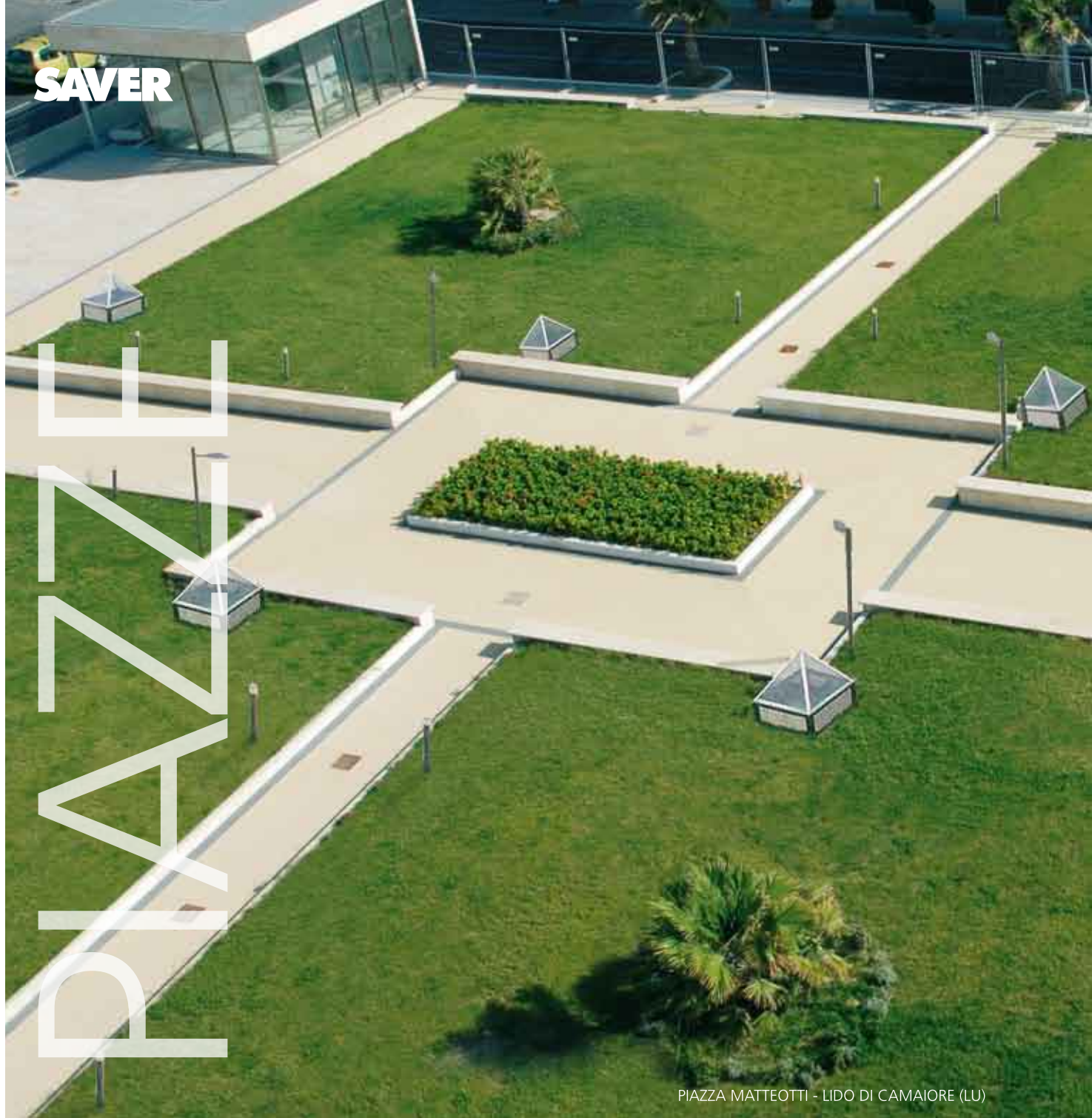
PIAZZA MATTEOTTI - LIDO DI CAMAIORE (LU)