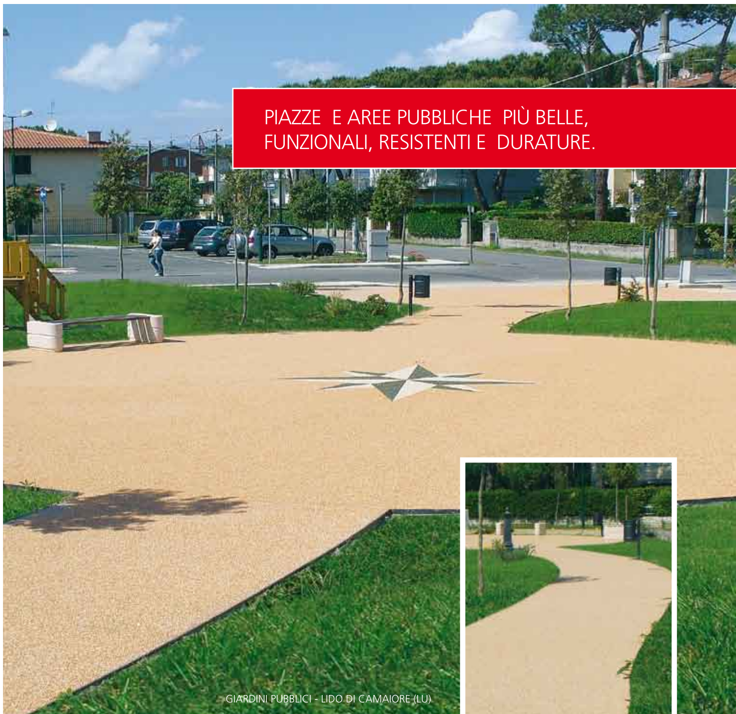
GIARDINI PUBBLICI - LIDO DI CAMAIORE (LU)

PIAZZE E AREE PUBBLICHE PIÙ BELLE, FUNZIONALI, RESISTENTI E DURATURE.